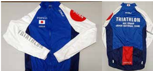
M 2XU 練習用サイクルジャージ (長袖) ¥21,000