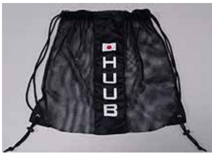
K メッシュ バッグ ¥3,000