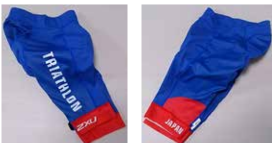
O 2XU 練習用サイクルショーツ (男子) ¥21,000