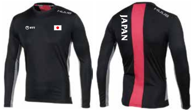
F ロングスリーブシャツ ¥7,000