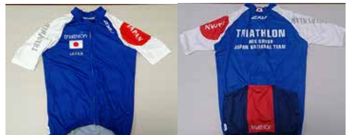
N 2XU 練習用サイクルジャージ (半袖) ¥16,500