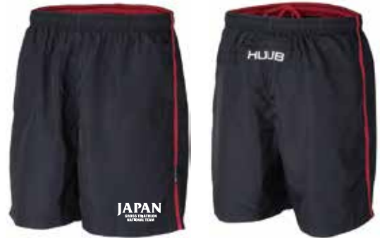
J ランニングパンツ ¥6,500