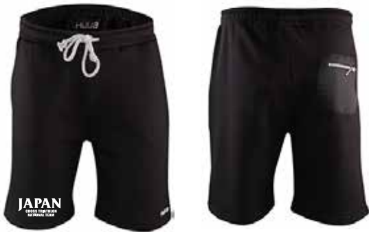
I カジュアル トラックパンツ ¥9,500