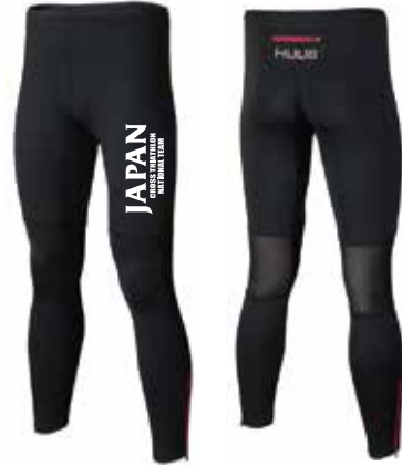
H ロングタイツ ¥11,000