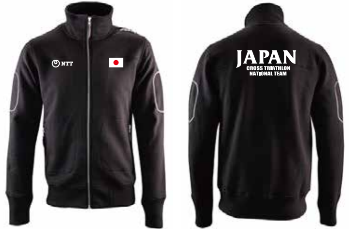
C ジップジャケット ¥11,000