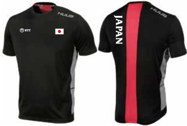
G Tシャツ ¥6,000