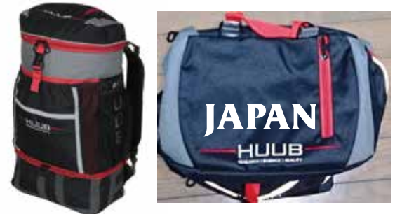
L トランジション バッグ ¥17,000