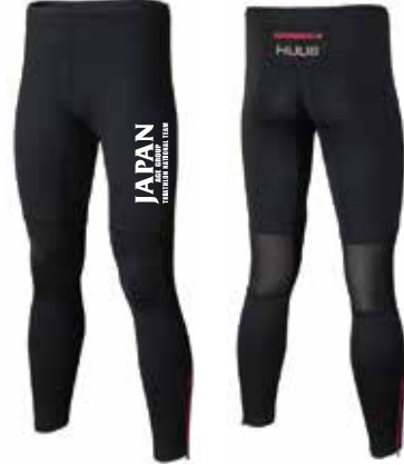
H ロングタイツ ¥11,000