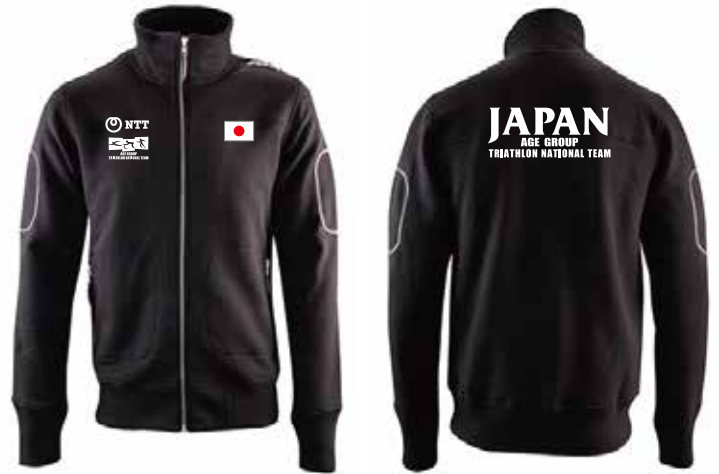
C ジップジャケット ¥11,000