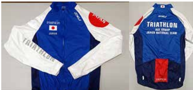
M 2XU 練習用サイクルジャージ (長袖) ¥21,000